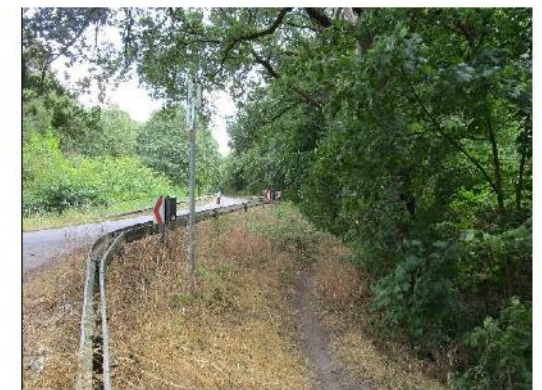
Kurve am Lieskauer Weg, Reitweg