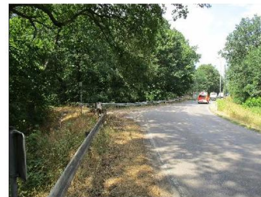
Kurve, Lieskauer Weg, Blickrichtg. Dölau