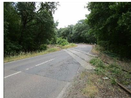
Bahnübergang, Blickrichtung Nietleben